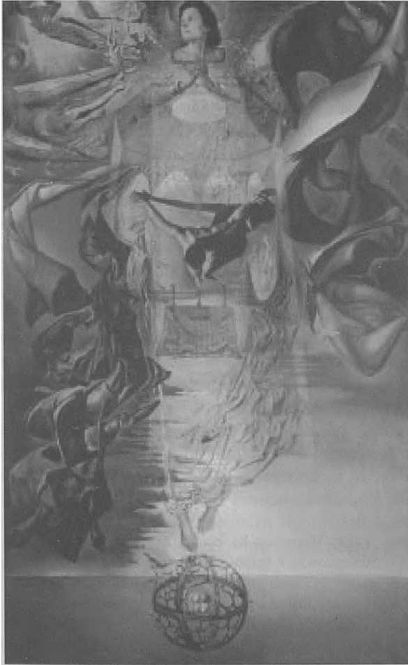
Foto 3. Salvador Dalí, Assumpció corpuscularia lapislazulina , 1952.

Dalí es proposà algun projecte experimental (de la mateixa manera que havia fet amb Buñuel en Un chien andalou el 1929) per tal de convertir el cinema en art modern, fent servir les seues paraules.