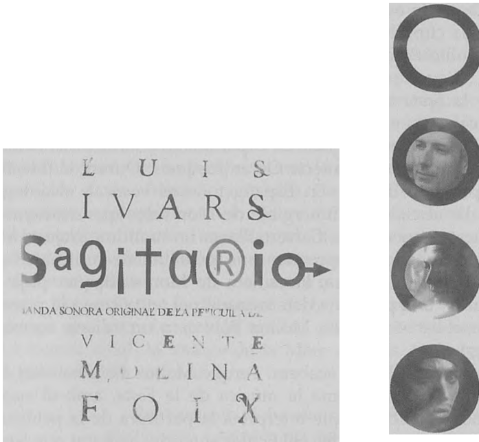
Foto 4. Portada del disseny de la banda sonora original de la pel·lícula Sagitario (2001), del director Vicente Molina Foix.

en la partitura original per compondre peces amb entitat pròpia que realçaren situacions dramàtiques diverses. Es tractava d'una operació de risc, la de fer servir el significat de la música de la representació en un altre marc expressiu, on es podien perdre els signes recognoscibles de la Festa . L'entusiasme per una intuïció no féu malbé la càrrega emocional que s'esperava a Elx. En aquest cas, al contrari que Saura i Dalí, en les pel·lícules dels quals la Festa era tan sols suggeriment, Molina Foix tragué el rendiment dramàtic que calia.